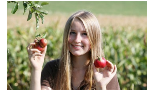
Mit den revitalisierten Streuobstwiesen werden altbewährte Obstsorten erhalten

Der aromatische Geschmack ist eines der Qualitätsmerkmale des Süßkirschbrandes, der in der Spezialitätenbrennerei „Prinz Zur Lippe“ in Meißen gebrannt und abgefüllt wird. Die regionalen Produkte sind sehr gefragt. Kaufen kann man sie zu Veranstaltungen wie dem Sommerfest im Botanischen Garten Dresden oder am Landgut direkt sowie online über unten genannte Website.